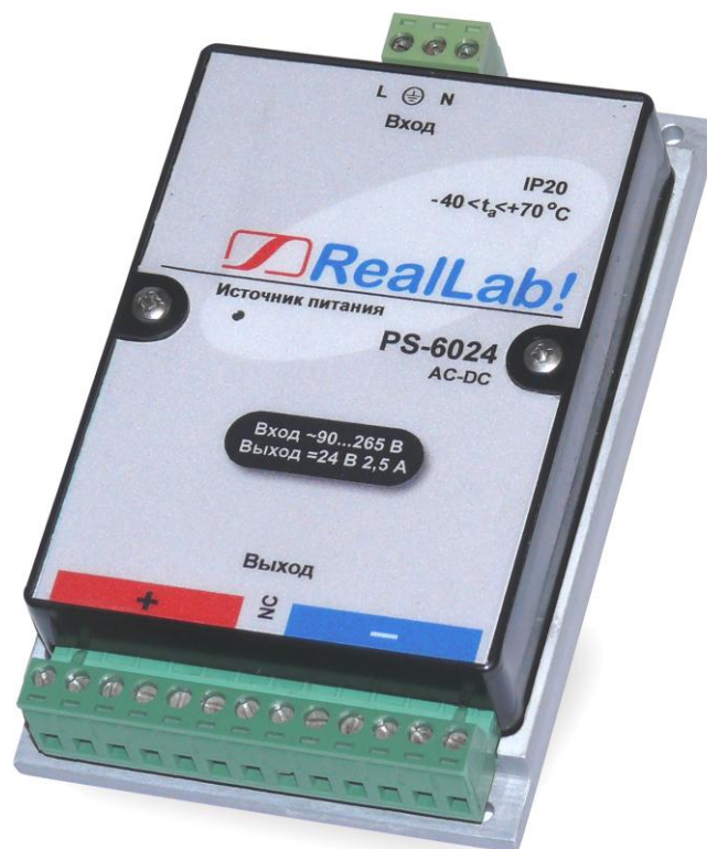
Рис. 1.1. Внешний вид источников питания серии PS

Источники питания снабжены разъемными клеммными винтовыми соединителями, позволяющими параллельно подключать до 6 контуров питания. Внешний вид источника питания приведен на рис. 1.1.